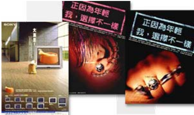
聯廣公司之平面識別