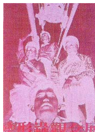
「變形蟲觀念展」之海報，1972。(資