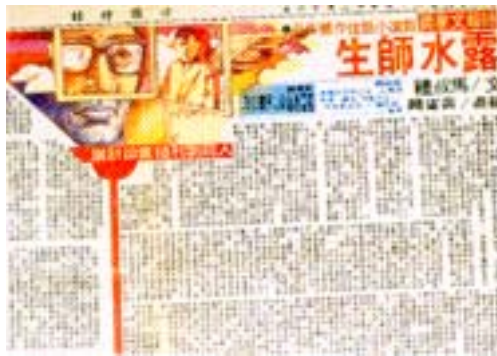
中國時報「人間」副刊，1978，黃憲鐘作品

對台灣設計界的推展功不可沒。中國時報「人間」副刊內容的改變與結合插畫的版面設計在 70 年代對新觀念的實驗與建立，有深刻的含義。而 1978 年起舉辦的時報廣告金像獎，至今第 27 屆，開啓了國內有系統有組織具規模的廣告獎先聲，是推動國內廣告設計水準與表現最大的助力。