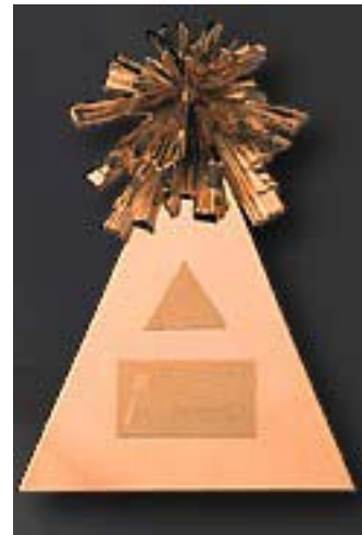
時報廣告金像獎獎座