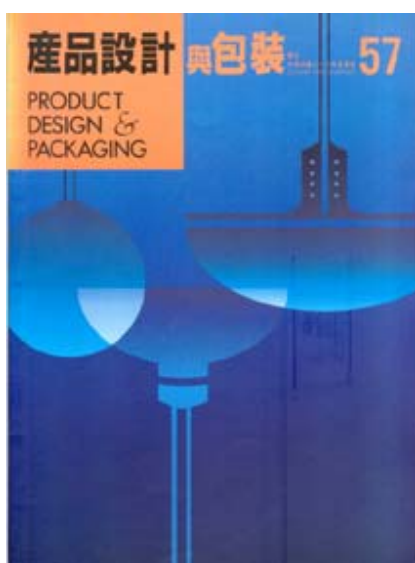
外貿協會出版之「設計與包裝」雜誌，vol.57，1994